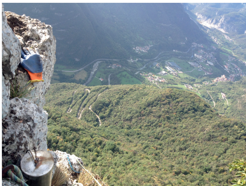
LIBRETTO DI VIA CON VISTA SULLA VALDASTICO